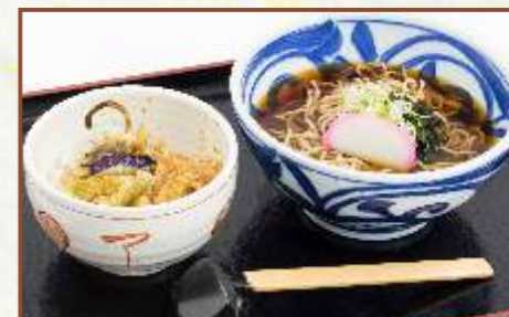
野菜天丼とそば定食 (そばの温・冷選べます) 税込730円