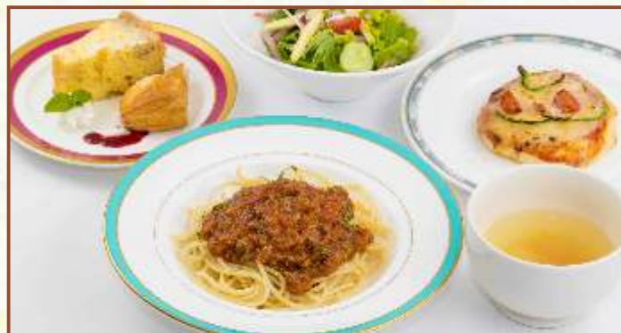
レディースセット (パスタ・ピザ・スープ・サラダ) 税込870円