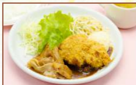
手ごねメンチ&焼肉 (スープ・ライス付) 税込830円