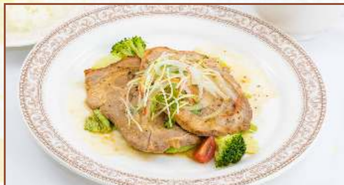
特製豚焼肉 (ライス・スープ付) 税込880円