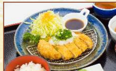
おろしロースとんかつ定食 (ご飯・味噌汁・小鉢付) 税込830円