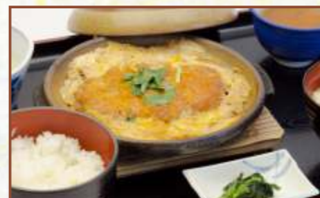
カツ煮込み定食 (ご飯・味噌汁・小鉢付) 税込830円