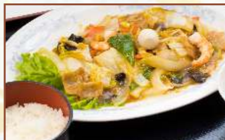
五目うま煮定食 (ご飯・中華スープ付) 税込800円