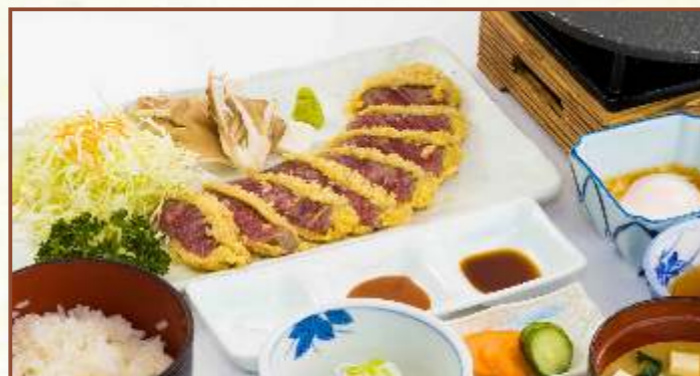
福島牛 牛カツ御膳 (牛カツ・味噌汁・小鉢・お新香) 税込2,980円