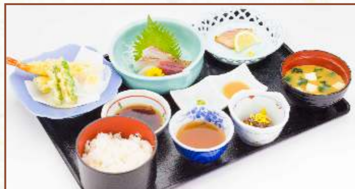
彩り膳 (天ぷら・刺身・焼き魚・味噌汁・小鉢) 税込1,300円