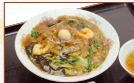
あんかけ焼きそば (中華スープ付) 税込730円