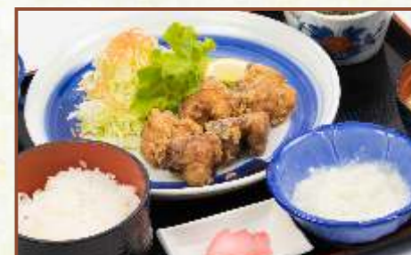
塩麴おろし唐揚げ定食 (ご飯・味噌汁・小鉢付) 税込780円