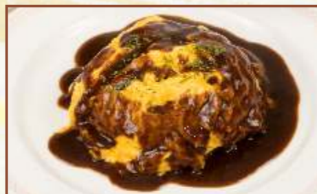
オムライス (スープ・サラダ付) 税込780円