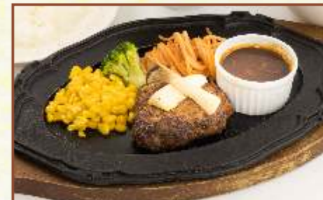
鉄板ハンバーグ (福島県産牛使用) (スープ・サラダ・ライス付) 税込1,050円