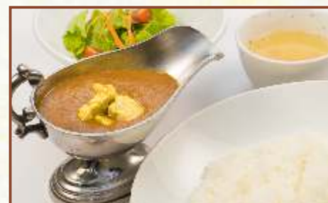
ポークカレー (サラダ・スープ付) 税込730円