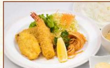
ミックスフライ (カニコロッケ・エビフライ・ヒレカツ) (スープ・サラダ付) 税込850円