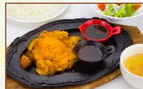
鉄板チキングリル2種のソース (スープ・サラダ・ライス付) 税込830円