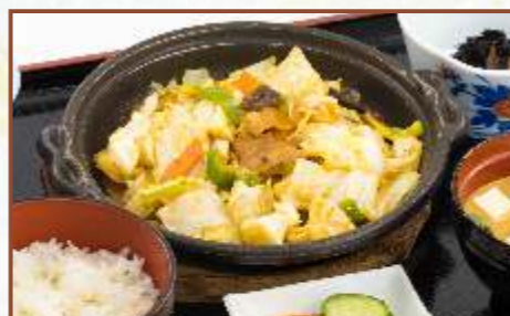
豚肉と味噌野菜炒め定食 (ご飯・味噌汁・小鉢付) 税込800円