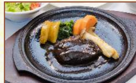
熟成ブラックデミソースハンバーグ (スープ・サラダ・ライス付) 税込1,050円