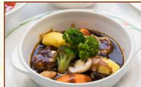
ビーフシチュー (スープ・サラダ・ライス付) 税込1,100円