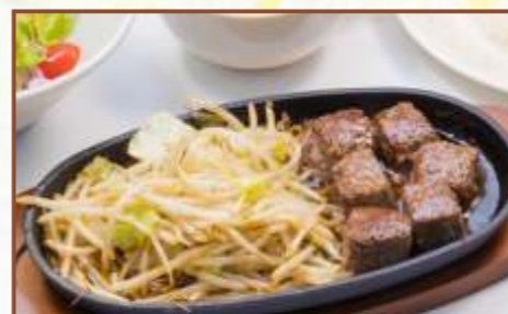
サイコロステーキ (スープ・サラダ・ライス付) 税込950円