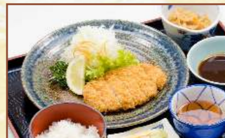
ロースとんかつ定食 (ご飯・味噌汁・小鉢付) 税込830円