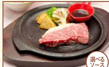
福島牛A5サーロインステーキ (洋風ソース・和風ソース) (スープ・サラダ・ライス付) 税込3,500円