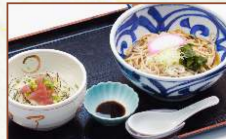
まぐろブツ丼とそば定食 (そばの温・冷選べます) 税込730円