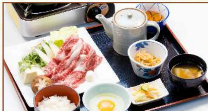
福島牛 すき焼き御膳 (福島牛すき焼き・味噌汁・小鉢・お新香) 税込3,500円