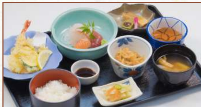
彩り膳 (天ぷら・刺身・焼き魚・ご飯・味噌汁・小鉢) 税込1,300円