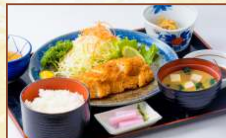
チキンカツ定食 (ご飯・味噌汁・小鉢付) 税込800円