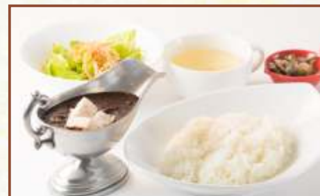
ブラックカレー (サラダ・スープ付) 税込780円