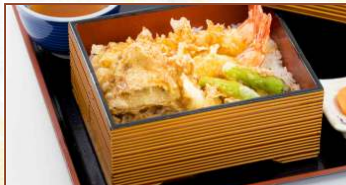
海老天重 (味噌汁・小鉢付) 税込980円