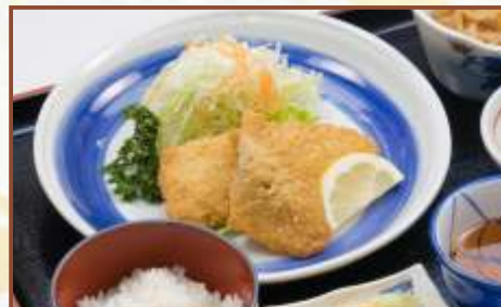
白身魚フライ定食 (ご飯・味噌汁・小鉢付) 税込800円