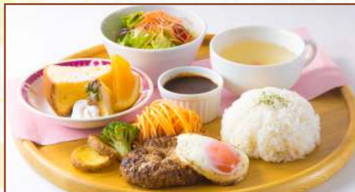
ワンプレートハンバーグ (ハンバーグ・ライス・スープ・サラダ・デザート) 税込1,100円