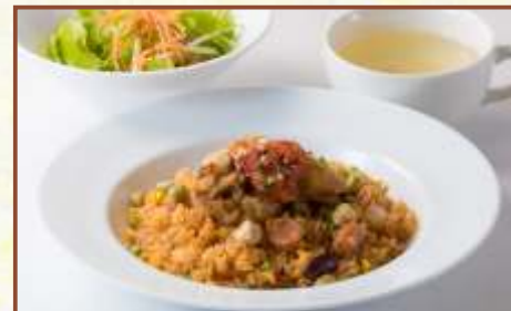
ジャンバラヤ (スープ・サラダ付) 税込880円