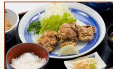
唐揚げ定食 (ご飯・味噌汁・小鉢付) 税込800円