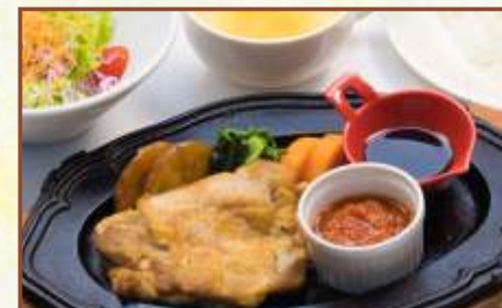
鉄板チキングリル2種のソース (スープ・サラダ・ライス付) 税込870円