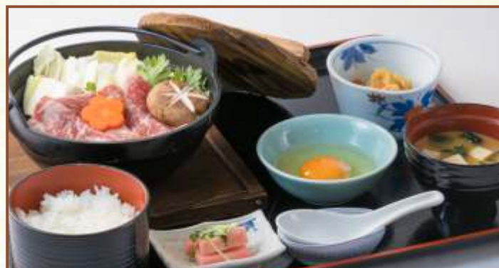
福島牛すき鍋膳 (福島牛すき鍋・味噌汁・小鉢・お新香) 税込2,500円