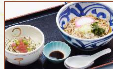
まぐろブツ丼とそば定食 (そばの温・冷選べます) 税込780円