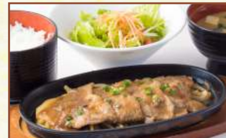
鉄板生姜焼 (スープ・サラダ・ライス付) 税込950円